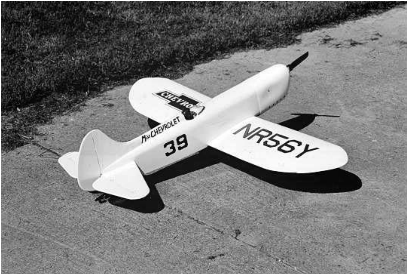
Fantasy 2000: Modell von Hansjörg Bienz, das bereits im September vorgeflogen wurde

Offizielles Mitteilungsorgan der Fluggruppe Zofingen / Redaktion H. Lüscher