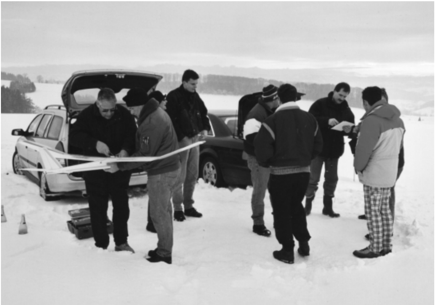
Die Modellflugsaison 2000 ist eröffnet

Offizielles Mitteilungsorgan der Fluggruppe Zofingen / Redaktion H. Lüscher